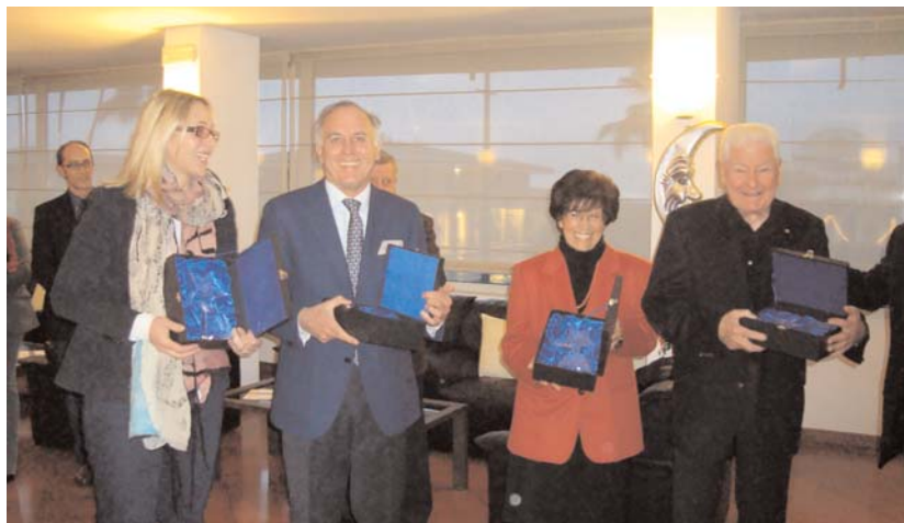
La consegna di un riconoscimento della Federalberghi ai quattro Presidenti delle Associazioni della Versilia