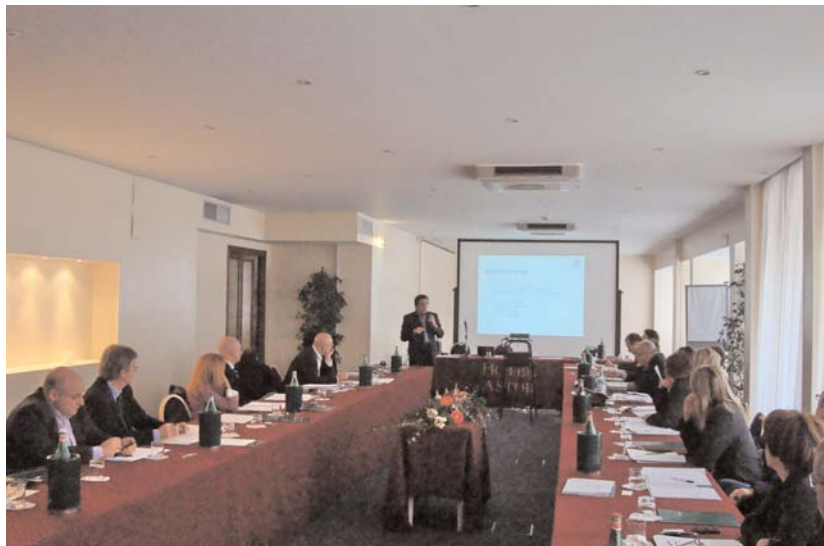
Un momento dei lavori

Le assise sono coincise con la costituzione dell'Associazione Federalberghi Versilia nata dalla fusione delle